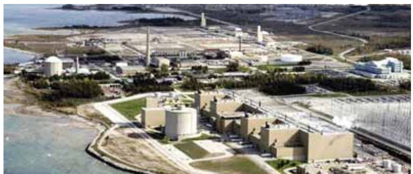
L'électricité peut constituer une forme d'énergie propre lorsqu'elle est produite par des centrales nucléaires comme les installations de Bruce Power en Ontario.

Parce que l'uranium contient des milliers de fois plus d'énergie par unité de poids que les combustibles fossiles, la quantité de déchets générés par une centrale nucléaire est très faible et ceux-ci sont gérés de façon rigoureuse et stockés en toute sûreté sur le site même. La Société de gestion des déchets nucléaires ( www.nwmo.ca ) pilote le processus de gestion à long terme du combustible nucléaire irradié du Canada.