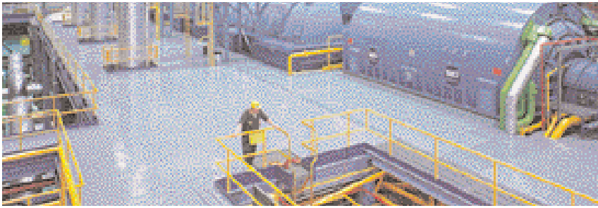
L'énergie nucléaire fournit actuellement près de 14 % de l'électricité dans le monde et représente une solution fort intéressante pour remplacer les combustibles fossiles.

La France tire 76 % de son électricité de l'énergie nucléaire, la Lituanie 73 % et la Belgique 54 %. Ce sont les pays qui comptent le plus sur cette filière. Quinze pays produisent à partir d'énergie nucléaire plus du quart de leur électricité. Avec 104 réacteurs en exploitation, qui répondent à près de 20 % de leurs besoins en électricité, les États-Unis possèdent le parc nucléaire le plus puissant de la planète. Ici même, au Canada, environ 15 % de l'électricité produite provient des centrales nucléaires. Les 16 réacteurs en exploitation en Ontario ont produit 53 % de l'électricité de la province en 2009.